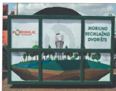
Slika 2. Mobilno reciklažno dvorište

U nekoliko navrata provedeni su inspekcijski nadzori od strane Ministarstva zaštite okoliša i prirode, te nisu uočeni veći nedostatci, a manje primjedbe inspekcije uvažile su se i korigirale u najkraćem mogućem roku.