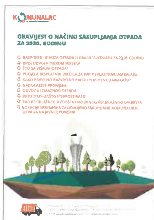
Slika 3. Obavijest o načinu sakupljanja komunalnog otpada u 2020. godini – Grad Vukovar

Kako bi korisnike pravovremeno informirali o promjenama te im pružili i ostale korisne informacije o načinima i uvjetima postupanja s otpadom na području grada Vukovara, i ove godine na kućne adrese korisnika usluge ispušten je oko 10.700 komada Obavijesti o načinu sakupljanja komunalnog otpada u 2020. godini – Grad Vukovar (Slike 3.), te su korisnicima u individualnim kućanstvima podijeljene vrećice za papir i plastiku. Na kraju 2019. godine broj korisnika u kućama iznosio je 6.609, a broj korisnika u zgradama 4067.