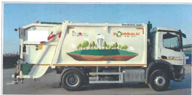
Slika 1. Novo komunalno vozilo

U rujnu 2019. godine počelo je s radom i mobilno reciklažno dvorište koje se postavljalo na ukupno 10 lokacija (naselja) u Gradu Vukovaru, a koje služi za odvojeno prikupljanje i privremeno skladištenje manjih količina iskoristivih vrsta otpada iz kućanstva (Slika 2.).