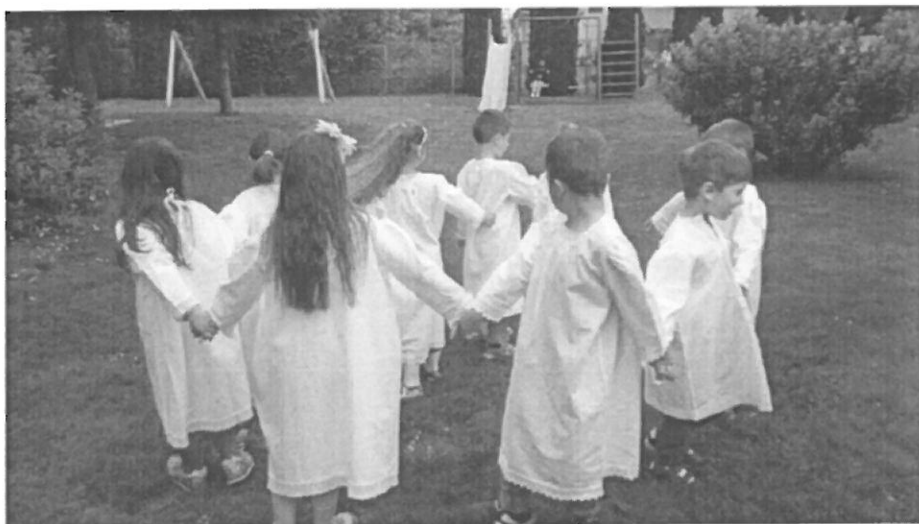
Slika br.1. Tradicijske igre

Kako djeca danas većinu vremena provode pred ekranima računala, TV-a, cilj nam je bio djecu udaljiti od tehnologije te ih poučiti kako su se prije djeca igrala, te da je za zdravlje puno važnije kretati se i igrati nego sjediti. To smo uspjeli i ostvariti! Djeca su sama svakodnevno započinjala igru, organizirali se u ekipe i imali zagarantiranu zabavu i to po jednostavnom pravilu: „čim više to bolje“. Primjetili smo da su neke igre koje smo igrali tijekom vremena promjenile pravila, ovisno o podneblju i generaciji koja ih je izvodila. Ali radi se uglavnom o nijansama. Važno nam je bilo da su djeca nekim starim/novim igrama više vremena provodili na svježem zraku s prijateljima i tako pomogli da se te stare igre ne zaborave.