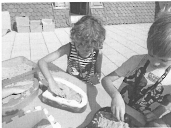
Slika br. 1. Mali arheolozi

Polazeći od pretpostavke za slobodnim, kreativnim izražavanjem, potrebe za zadovoljavanjem njegove radoznalosti odlučili smo se za rad na projektu koji potiče djecu da sami postanu tvorci vlastite spoznaje, sami otkriju put do informacije, traže njezin izvor i na kraju te informacije koriste. Odabrana tema pokazala se idealnom za: skupljanje, istraživanje, promatranje, proučavanje, identificiranje i vježbanje komunikacijskih vještina djece. Dječji interes znatno je proširio planirane teme i potaknuo na realizaciju novih aktivnosti. Stalna prezentacija dječjih znanja i uradaka koji su nastali kao rezultat njihove nepresušne radoznalosti i želje za novim, omogućili su roditeljima novu dimenziju spoznavanja mogućnosti svoje djece. Rad na projektu pridonio je i proširenju znanja svih koji su bili uključeni u njega. U suradnji s Muzejom vučedolske kulture „mali Vučedolci“ su izašli i u njihovom časopisu Adorant.