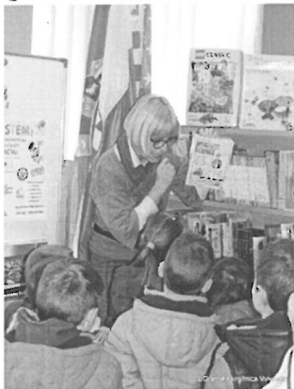
Slika br. 1. Slikovnica

Upoznali smo djecu s različitim vrstama slikovnica (taktilne, za mirisanje) i različitih namjena (priče za laku noć, problemske, enciklopedije) te razvijali kod njih interes za slikovnicu