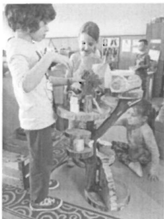
Slika br.1. Vrtić bez igračaka

Iako je igra glavna djetetova aktivnost kroz koju se razvija i uči, gotove kupovne igračke djeci su bile dosadne, nisu zadovoljavale njihovu znatiželju i njihove potrebe, ni poticale kreativnost. Ponudom prirodnog i ne oblikovanog materijala, pozitivnim i plodonosnim načinom, usadili smo im navike, sposobnosti i stilove razmišljanja koji će im pomoći u prevladavanju dosade. Djeca su stekla iskustva u recikliranju drveta, papira, kartona, plastike, tkanine u predmete za igru i svakodnevnu uporabu.