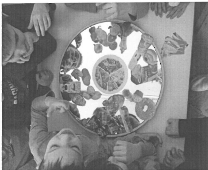
Slika br. 1 Živjeti zdravo

Postaje otvorenije u komunikaciji prilikom razgovora o zdravom načinu života, posjeduju nova znanja i spoznaje, zadovoljena je dječja potreba za istraživanjem, znanjem i kretanjem, djeca razvijaju pozitivan stav prema unosu zdravih namirnica u organizam, propituju vrijednost hrane koju konzumiraju, te razvijaju pozitivan stav prema tjelovježbi, kao preduvjetu za dobar cjelokupni razvoj organizma, razvijaju interes za poduzetništvo i stvaralaštvo, i aktivno sudjeluju u životu skupine i zajednice.