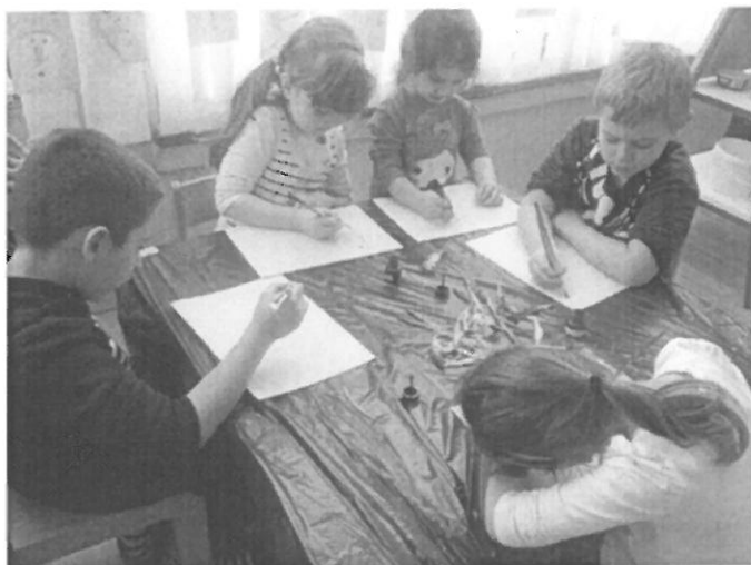
Slika br.1. Ptice stanarice

Ovaj projekt pokazao je koliko su djeca naučila na kraju, jer su početkom projekta imali saznanja da su sve ptice jednake. Raznovrsnim aktivnostima, poticajnim sadržajima i mnogobrojnim slikama i literaturom djeci je približen pojam ptica. Naučili su da postoje ptice stanarice i ptice selice, njihova imena i prepoznavanje po karakteristikama i obilježjima. Različitim aktivnostima djeca su potaknuta na vlastito istraživanje, govorne, glazbene, likovne i radno – praktične aktivnosti. Međusobno su razgovarali o pticama (najčešće onima koje su mogli sami vidjeti i uočiti u prirodi), dogovarali se i surađivali. U slobodnim aktivnostima uočila sam da su djeca kroz ovaj projekt proširila svoja saznanja o pticama te usvojila važnost njihovog aktivnog djelovanja u zimu, kada ptice nisu u mogućnosti same pronaći hranu.