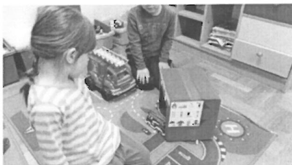
Slika br. 1 Vatrogasci

Kroz provedbu projekta i realizacijom aktivnosti postigli smo da se djeca osjećaju kao ravnopravni članovi zajednice. Djecu smo upoznale sa zanimanjem službi koje vode brigu o sigurnosti i koje pomažu ljudima u nevolji. Naučili smo da vatrogasci ne gase samo požare, učili smo o sigurnosti neposrednim učenjem, a ne kroz frazu sigurnosti i zaštite. Imali su priliku upoznati vatrogasca i direktno se upoznati s njegovim zanimanjem. Nakon projekta djeca su osvijestila činjenice da su sigurna u svom okruženju i na koje oblike i od koga mogu računati na pomoć. Naučili su kako se ponašati u slučaju nezgode i što učiniti u kriznoj situaciji. Naučila su brojeve telefona službi koje ljudima pomažu u nevolji.