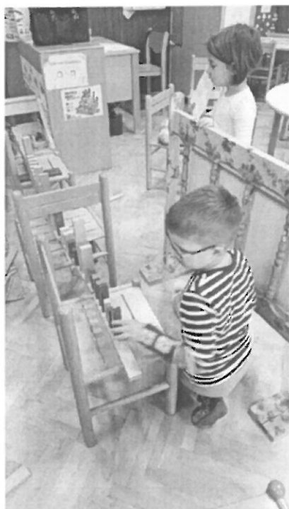
Slika br.1. Složne ruke čuda grade

Vidljivi su pomaci u razvoju socijalnih vještina, dosljednom izvršavanju zadataka i stjecanju samopouzdanja. Nakon ovog projekta zanimljivo je bilo vidjeti i reakcije roditelja koji su bili podosta iznenađeni radom i kreativnošću svoje djece. Stručnim djelatnicima od velike važnosti bila je strpljivost, osluškivanje djece te prepoznavanje trenutka pogodnih za djelovanje. Ukoliko radimo umjesto djeteta nešto što ono može samo, dijete gubi interes. Omogućili smo djeci osjećaj uspjeha, stjecanje sigurnosti u sebe i osjećaj ponosa. Uz našu podršku stvorili smo uvjete za učenje i osvješćivanje procesa učenja i postizanje postavljenog cilja. Važno je omogućiti djeci da uče na svojim pogreškama u sigurnom i poticajnom okruženju u vrtiću. Dio procesa učenja jest i neuspjeh te pokušaji njegova prevladavanja i pronalaženja konstruktivnih rješenja. Mi smo ih ovim projektom svladali.