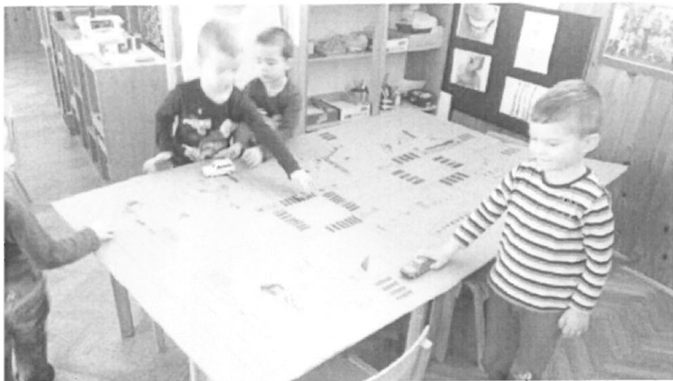
Slika br.1. Automobil – ljubimac velikih i malih

Djeca su stekla znanja o automobilu kao velikoj pomoći čovjeku ali i o tome da se trebamo odgovorno ponašati s „tom lijepom jurilicom“.