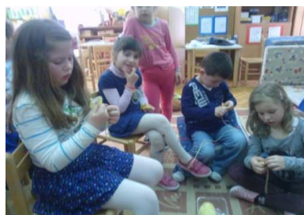
Slika 6. Maslačak sijelo – u društvu je sve lakše