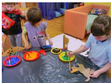
Slika 1. Izrada životinja

Provedbom projekta djeca su crtala, slikala, izrezivala, modelirala, lijepila, kapala svijećama. Dobra suradnja i zajednički trud uvelike je pridonio , kako djeci, tako i odgojiteljima, što se i danas osjeti kroz male dječje razgovore i zapitkivanje djece E.Š.: „Kada ćeš nam opet donijeti svog zamorca?“