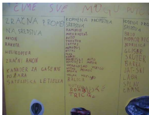
Slika 6. Čime sve možemo putovati?