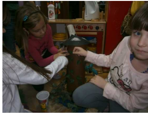
Slika 2. Izrada kućice loših djela