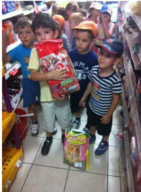
Slika 3. Hrana za životinje iz poplavljenih područja