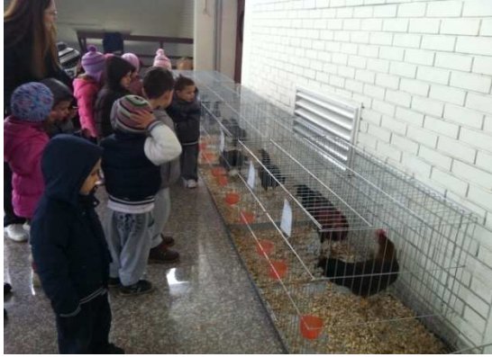
Slika 1. Na izložbi malih životinja

aktivno sudjelovala u komunikaciji i iznošenju svojih dojmova. Roditelji su pripomogli u prikupljanju određenog materijala koje smo donirali za životinje nastradale u poplavama. Uočili su aktivnost svoje djece u sudjelovanju u aktivnostima i tako i sami postali aktivni. Pokušali smo suradnjom s komunalnim i udrugom "Daj šapu" no nismo dobili pozitivan odgovor u želji da postavimo eko kante i na taj način stvorimo preduvjete za čišće i zdravije dječje igralište.