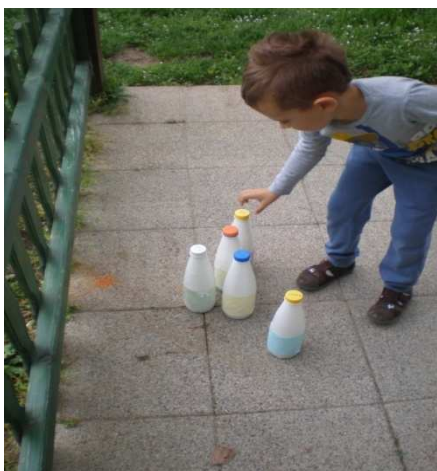
Slika 3. Naša kuglana