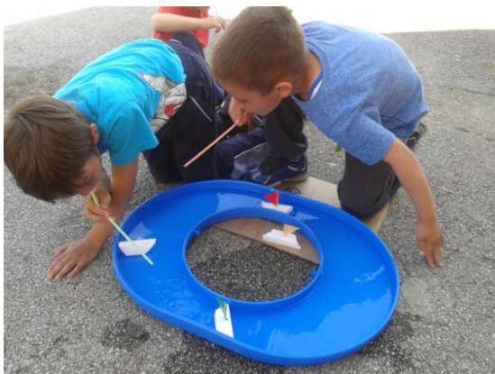
7. Natjecanje u jedrenju