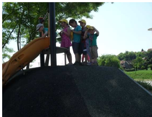
Slika 6. Strpljivo čekamo red