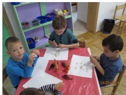
Slika 2. Crtanje