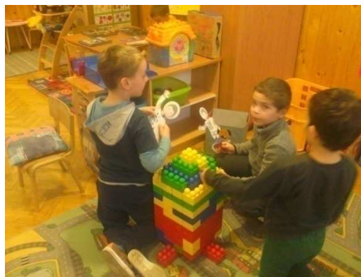
Slika 2. Igra lutkama u centru građenja