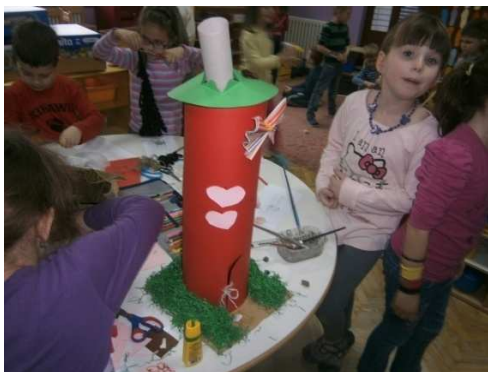
Slika 3. Izrada kućice dobrih djela