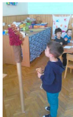
Slika 6. Lutka pričalica