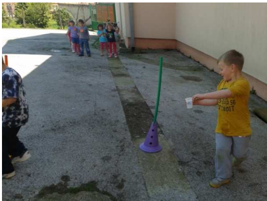
Slika 5. Natjecanje u spretnosti