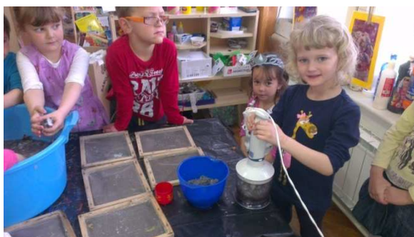
Slika 5. Recikliramo papir