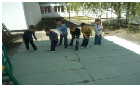
Slika 2. Igra 'Tko će bliže' s kamenčićima