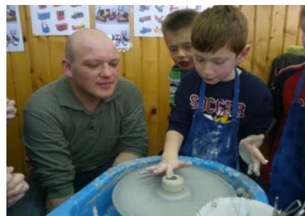
Slika 4. Lončarenje