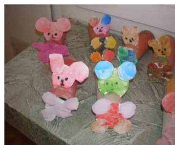
Slika 4. Medvjedići za dramatizaciju