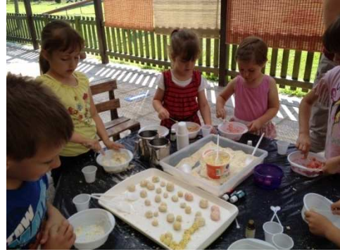
Slika 2. Ljetne aktivnosti u DV Vukovar 1