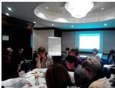
Slika 1. UNICEFOVA radionica za voditelje radionica za roditelje 'Rastimo zajedno'

spasiti nepotrebnih sukoba (JA – poruke), osvijestili što očekujemo, dopuštamo i zabranjujemo djetetu u određenoj situaciji ali isto tako i razgovarali o tome znaju li djeca što se od njih očekuje, što im se dopušta, a što zabranjuje? Bilo je govora o postavljanju pravila ponašanja i o vrstama odgovornosti koje imamo kao roditelji. Osvijestili smo određena ponašanja koja smo iskusili kao djeca naših roditelja, osjetili se slobodnim procijeniti ih i odabrati hoćemo li ih koristiti na našoj djeci ili odabrati nove. Također, podsjetili smo se što nas snaži kao roditelje i daje nam inspiraciju za roditeljstvo. Zahvaljujući angažmanu naših djelatnica ali i roditeljskoj spremnosti za dijeljenje iskustva i mišljenja te podrške drugim roditeljima - ove radionice su bile ugodno mjesto za druženje, razmjenu znanja i iskustva i rad na sebi. Tome u prilog govori i upitnik za evaluaciju koji su ispunili roditelji na kraju radionica.