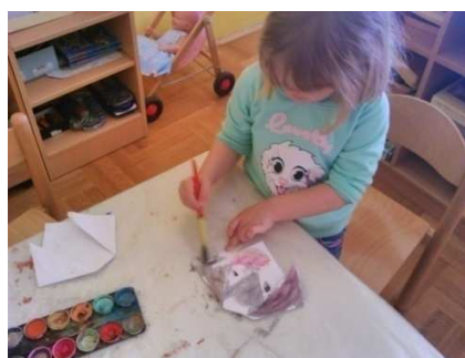
Slika 3. Origami