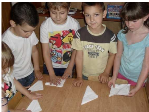
Slika 3. Slaganje salveta prije objeda