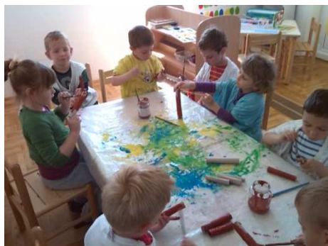
Slika 4. Izrada makete za igru dinosaura