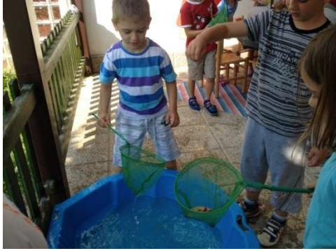
Slika 1. Ljetne aktivnosti u DV Vukovar 1