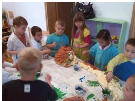
Slika 6. Izrada makete za igru dinosaura