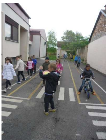
Slika 7. Prometni poligon u našem vrtiću