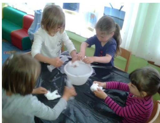
Slika 2. Igra vodom