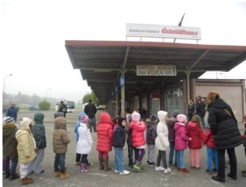
Slika 1. Posjet autobusnom kolodvoru

Projekt je bio osobito važan djeci jer im je dao nove smjerove, nove interese i nove ideje. Svako je dijete dalo svoj doprinos pričom, crtežom, slikom i osobnom aktivnošću. Tijekom projekta dobijali smo potrebne informacije od roditelja kako ih djeca upozoravaju na sve nepravilnosti u prometu koje uoče za vrijeme vožnje automobilom ili kada su kao pješaci sudionici prometa. Iznimna suradnja roditelja, vanjskih čimbenika, stručnog tima i ostalih djelatnika vrtića pridonijela je uspješnosti realizacije projekta.