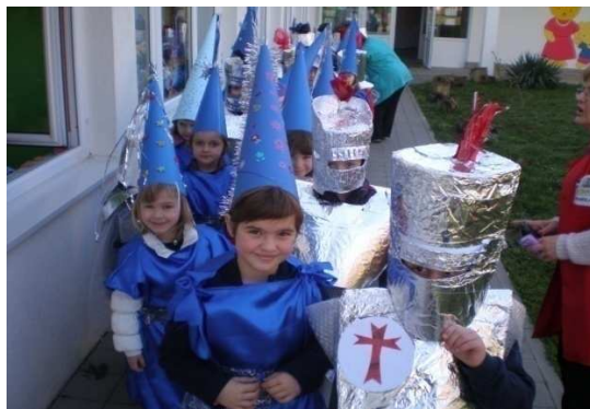
Slika 5. Vitezovi i princeze