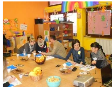
Slika 2. UNICEFOVE radionice s roditeljima DV Vukovar 1