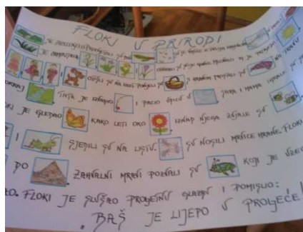
Slika 2. Slikopriča