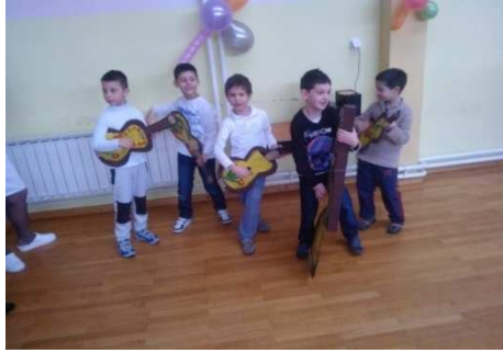
Slika 7. 'Vesela šokadija'