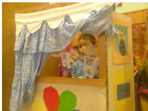
Slika 1. Igra štapnim lutkama

ovladati vještinom pokretanja lutki odlučujemo precizirati u naslovu te u daljnjoj razradi aktivnosti. Većina aktivnosti u evaluaciji projekta bila je usmjerena na ostvarivanje i oživljavanje pokreta naših lutaka. Novi smjer razvoja projekta daje nam izrada prave, krpene lutke. Ušli smo s djecom u raspravu kako i na koji način bi mogli napraviti krpenu lutku. Djeca su iznosila različite ideje. Dolazimo do zaključka kako nam je cilj u projektu s djecom izrađivati i usvajati osnovne pokrete u animiranju lutki, ali i zajedničko promišljanje kako se uspješno dogovarati i planirati svoje aktivnosti. U konačnici, projekt završavamo izrazito pozitivnim događajem u obliku završne svečanosti naše odgojne skupine pod nazivom: „Uhvati ritam dječje lutke“. Svečanost se odvija kroz zajedničko druženje, stvaralaštvo, kreativnost i zabavu djece i njihovih roditelja, baka i djedova. Kroz izradu štapnih lutaka i scenografije za potrebe različitih igrokaza uključili su se svi koji su svojim dolaskom spontano postali sudionicima događaja. Poštujući prava djece da ih se čuje, pravo na sudjelovanje i na donošenje odluka upravo učeći čineći zadovoljili smo i utjecali na jačanje svih dječjih kompetencija što nam je i bio cilj projekta. S ovim događajem spontano završavamo s projektom “Uhvati ritam dječje lutke“.