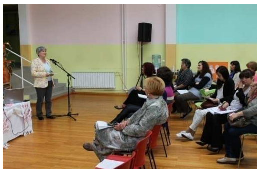
Slika 1. Pozdravna riječ ravnateljice DV Vukovar 1

Djelatnice dječjeg vrtić 'Vukovar 1' su u suradnji s Gradom Vukovarem, udrugom odgojitelja 'Terina' i dječjim vrtićem 'Vukovar 2' održale 4. 'Dane dječjih vrtića grada Vukovara' pod sloganom 'Jesmo mali, al' smo važni'. Odgojiteljice, stručne suradnice i ravnateljice vukovarsko – srijemske županije okupile su se 10. svibnja 2014. u područnom objektu Leptirić, dječjeg vrtića Vukovar 1 na predavanju Adrijane Višnjić Jevtić: Socijalna kompetencija – kompetencija djece i odraslih. U sklopu stručnog skupa održana je i izložba fotografija mladih autora u suradnji s Fotoklubom Vinkovci i Fotoklubom Vukovar 'Došle su nam rode'. Zbog loših vremenskih uvjeta, prikaz rada s djecom na Trgu Republike Hrvatske ove je godine izostao.