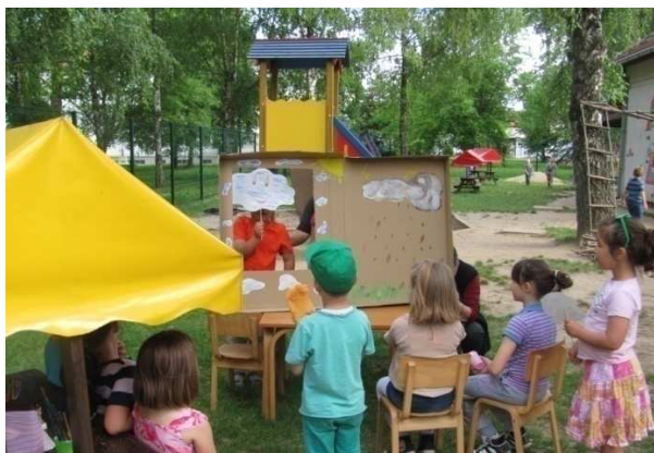
Slika 5. Kazalište djece i roditelja