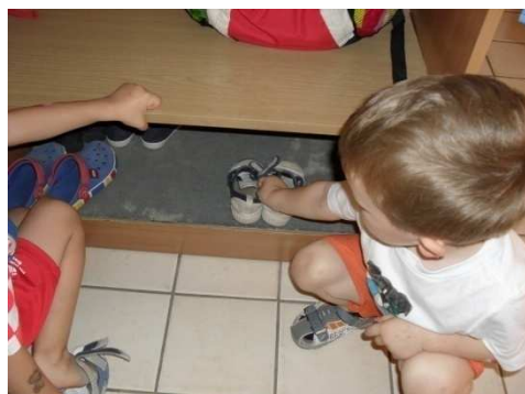
Slika 4. Uredna obuća u garderobi