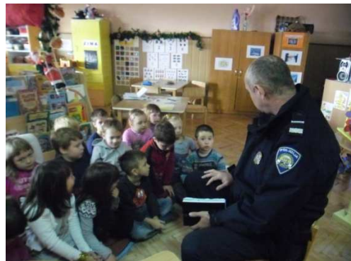
Slika 2. Posjet policajca skupini