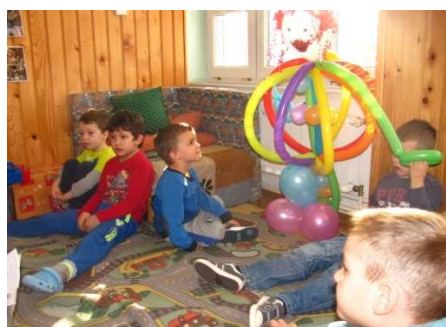
Slika 3. Klaun od balon