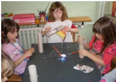
Slika 1. Izrada šume od tuljaca

Djeca su osvještana o mogućnostima ponovne upotrebe otpadnog materijala ako ga razvrstaju na ekološki prihvatljiv način – posebni spremnici. Djeca su spoznala da uz malo mašte i kreativnosti mogu sami izraditi igračke i društvene igre kojima će obogatiti svoju igru. Također su osvijestili da nije uvijek igračka iz trgovine ona “ prava“ nego da je ono što sami naprave puno vrijednije i ljepše. Roditeljima smo pružili mogućnost da zajedno sa svojom djecom izrade nešto novo i uživaju u igri otpadnim materijalom. Radom na projektu osvijestili smo različite mogućnosti izrade i kreiranja sredstava koja smo koristili tijekom cijele godine te time obogatili prostor u kojem boravimo.