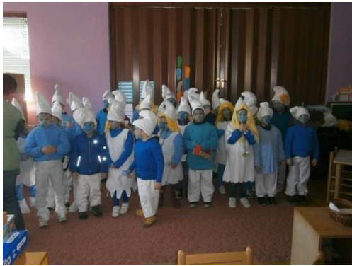
Slika 1. Štrumpfovi – Poklade

M.P.: Kada bih ja bio štrumpf sigurno bi bio Trapavko jer stalno nešto srušim.