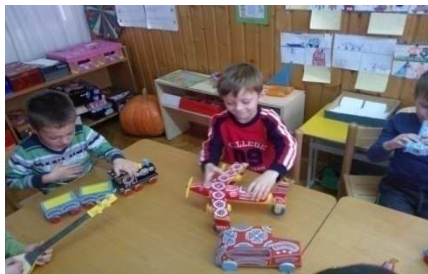
Slika 1. Istraživanja mogućnosti novih igračaka

Djeca su ovim projektom shvatila što znači riječ baština, tradicija, narodni običaji. Naučila su cijeniti stare stvari te se odnositi prema njima s poštovanjem jer su ona dio naše prošlosti i identiteta. Uočila su prednosti i lagodnost današnjeg života spram života u prošlosti kada su živjele njihove prabake. Djeca su se upoznala i stekla nova znanja i vještine o zanatima koja su polako počela odlaziti u zaborav. Promjenila su svoje mišljenje i stavove o narodnim pjesmama i plesovima, drvenim igračkama. Shvatili što znači “usmena predaja” te obećali nastaviti s prenošenjem tradicije i narodnih običaja našeg zavičaja kako se ne bi zaboravili. Naučili međugeneracijsku komunikaciju i uvažavanje tuđeg mišljenja. Shvatila važnost različitosti i uvažavanje istih