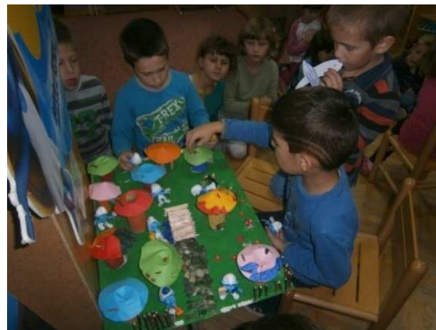
Slika 4. Izrada makete sela