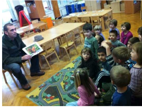
Slika 2. Posjet šumara našoj skupini