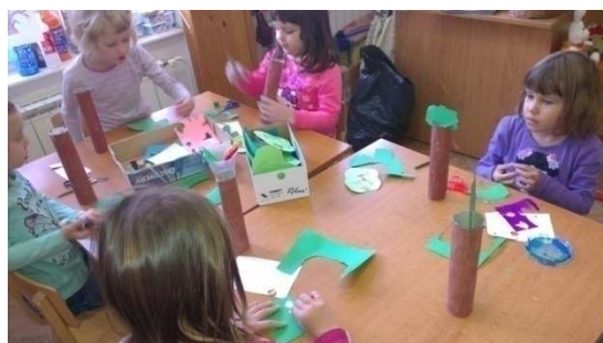
Slika 4. Izradi svoje stablo