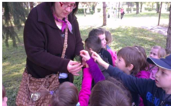
Slika 2. Zimzeleno drvo – opipaj!