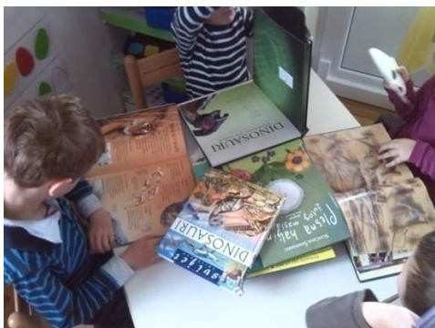
Slika 3. Dinosauri u slikovnicama