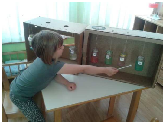
Slika 6. Vodeno glazbalo