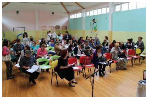
Slika 2. Odgojiteljice, stručne suradnice i ravnateljice vukovarsko-srijemske županije