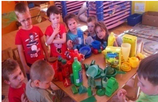
Slika 1. Grupiranje po boji

su primjećivati boje oko sebe i pokazivat interes za imenovanje boja, predmeta iz prirode i djetetovog okruženja (šireg i užeg).