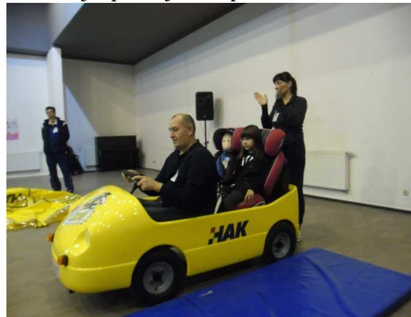
Slika 4. HAK-ove vježbe za sigurno kretanje u prometu