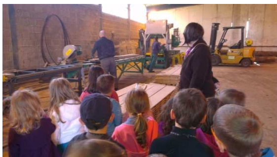
Slika 6. Posjet pilani