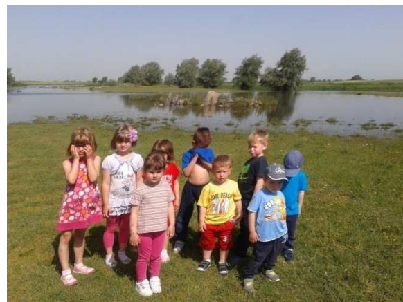
8. Posjet rijeci