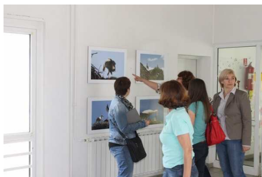
Slika 5. Izložba fotografija 'Došle su nam rode'

Ove pedagoške godine provedeno je ukupno 13 projekata u vrtićkim skupinama. Projekti su provedeni temeljem interesa djece, dječjih razvojnih značajki i afiniteta odgojiteljica.