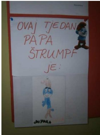
Slika 5. Podjela uloga u skupini