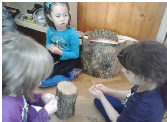
Slika 1. Koje je drvo tvrđe?