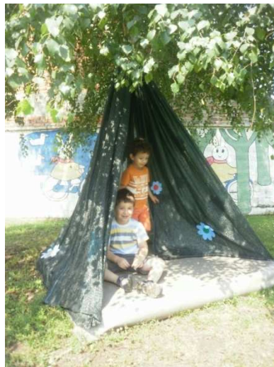
Slika 3. Ljetne aktivnosti u DV Vukovar 1