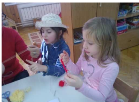
Slika 5. Pletenje