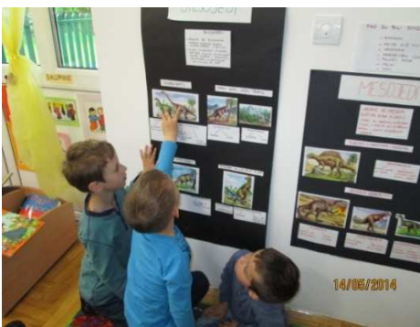
Slika 1. Slikopriča

Projekt su inicirala djeca, a odgojitelj je pratio tijek interesa djece i nastojao odgovoriti primjerenim poticajima. Djeca su tijekom projekta na temelju svog dotadašnjeg znanja i iskustva postavljala hipoteze te predlagala načine njihove provjere. Slijedeći njihove prijedloge odgojitelj je omogućio različite aktivnosti kojima bi obogatili svoja znanja istraživanjem knjiga, slikovnica i enciklopedija te izradom plakata. U projektu je naglasak bio na procesu učenja kroz igru, manipulaciji predmetima, razgovoru i istraživanju. Po završetku projekta djeca su došla do novih spoznaja (odbacivanje krivih hipoteza i prihvaćanje novih).