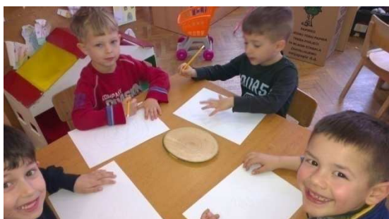
Slika 3. Koliko godina ima ovo drvo?