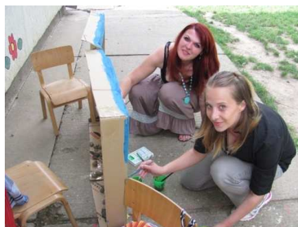
Slika 4. Mame u akciji