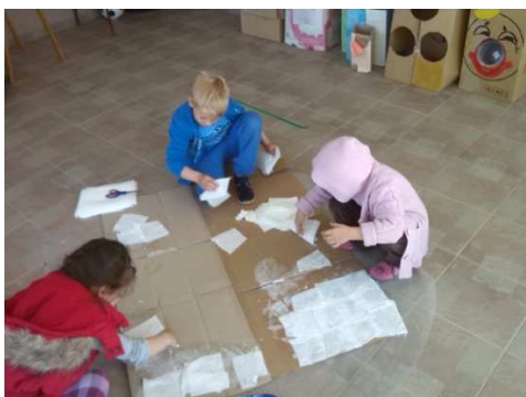
Slika 5. Izrada makete za igru dinosaura