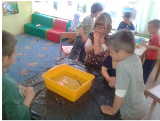
Slika 4. Što se topi – što se ne topi