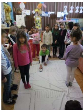
Slika 5. Raskrižje u sobi