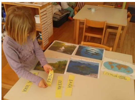
Slika 1. Imenovanje

H.P. – „Kako je hladan led. Vidi kako se topi.“