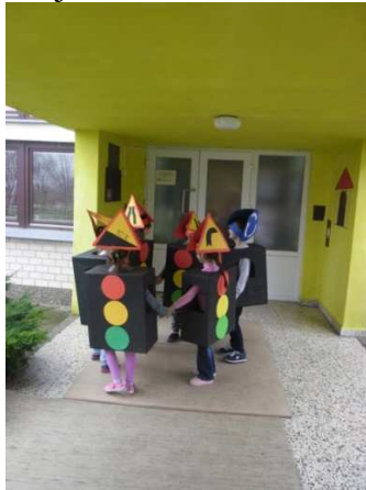
Slika 3. Pripreme za maskenbal