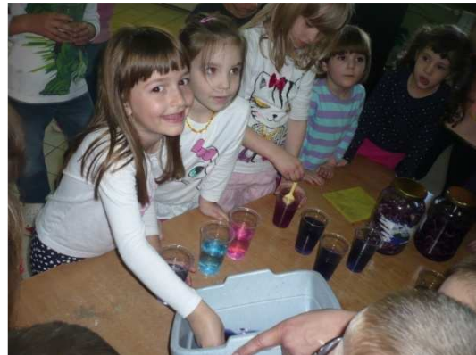
Slika 2. Stvaranje sekundarnih boja