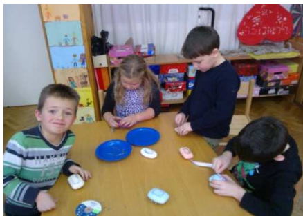
Slika 3. Izrada ukrasnih košarica od sapuna