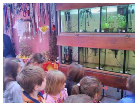
Slika 4. Posjet trgovini s kućnim ljubimcima