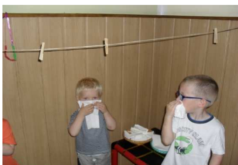
Slika 5. Upotreba maramice