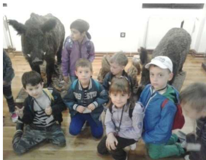
Slika 7. Posjet Šumarskom muzeju