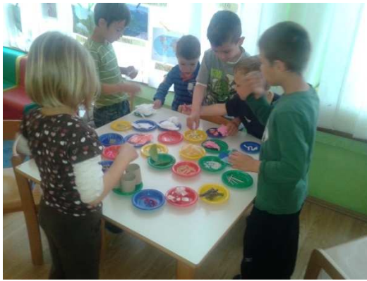
Slika 3. Što pliva – što tone