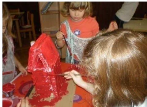
Slika 2. Izrada kućice iz bajke