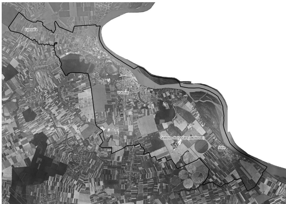
Slika 1: Naselja grada Vukovar, Izvor: Državna geodetska uprava - obrada autora

Grad Vukovar prostire se na površini od 100,0995 km 2 i sastoji se od 4 naselja: Lipovača, Sotin, Vukovar, Grabovo-dio (Ovčara, Jakobovac) prikazanih na slici 1.