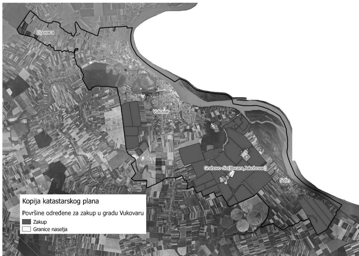
Slika 5: Površine određene za davanje u zakup