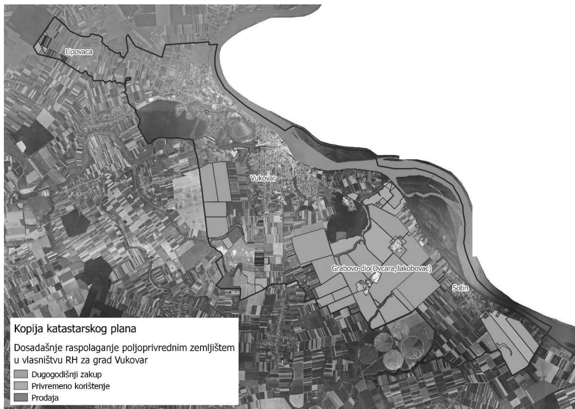
Slika 4: Prikaz dosadašnjeg raspolaganja poljoprivrednim zemljištem u vlasništvu RH