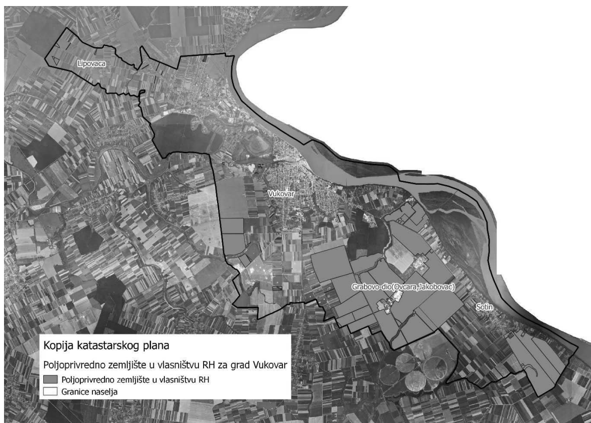
Slika 2: Državno poljoprivredno zemljište na području grada Vukovara