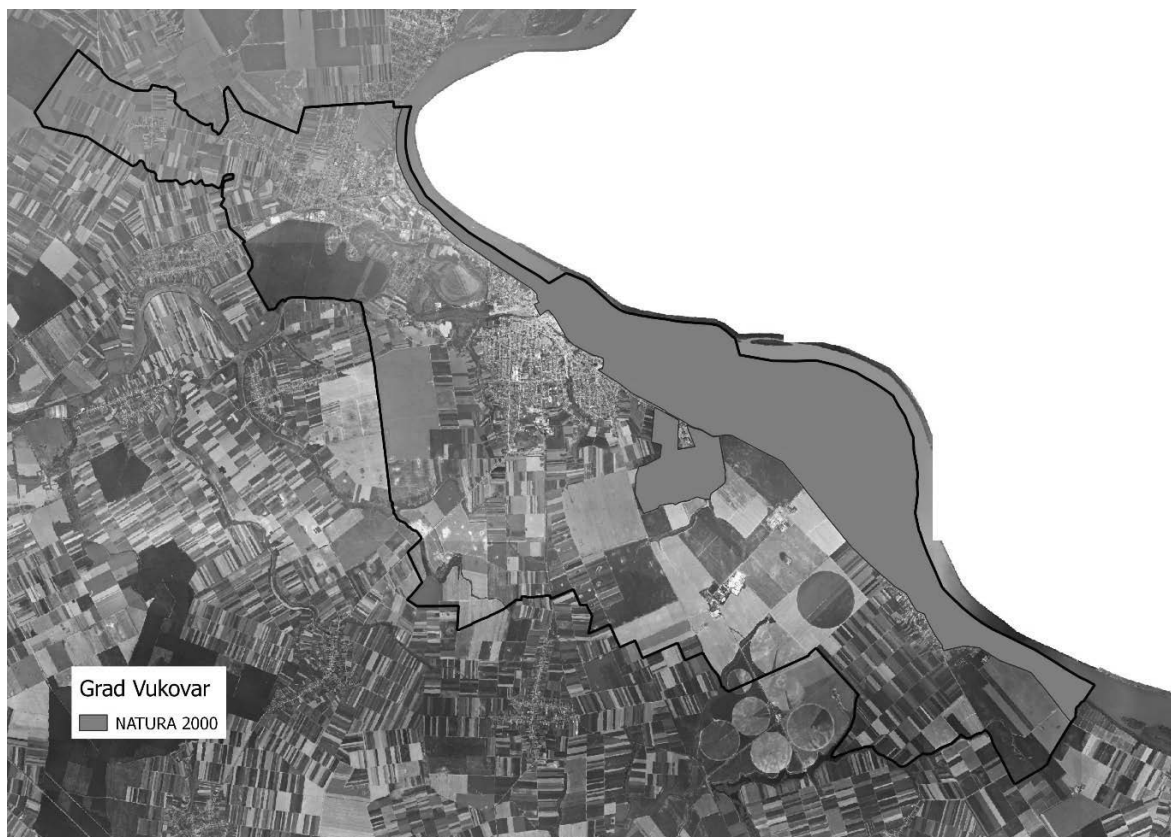
Slika 3: Zaštićena područja (Natura 2000), Izvor: Hrvatska agencija za okoliš i prirodu - Bio portal - obrada autora