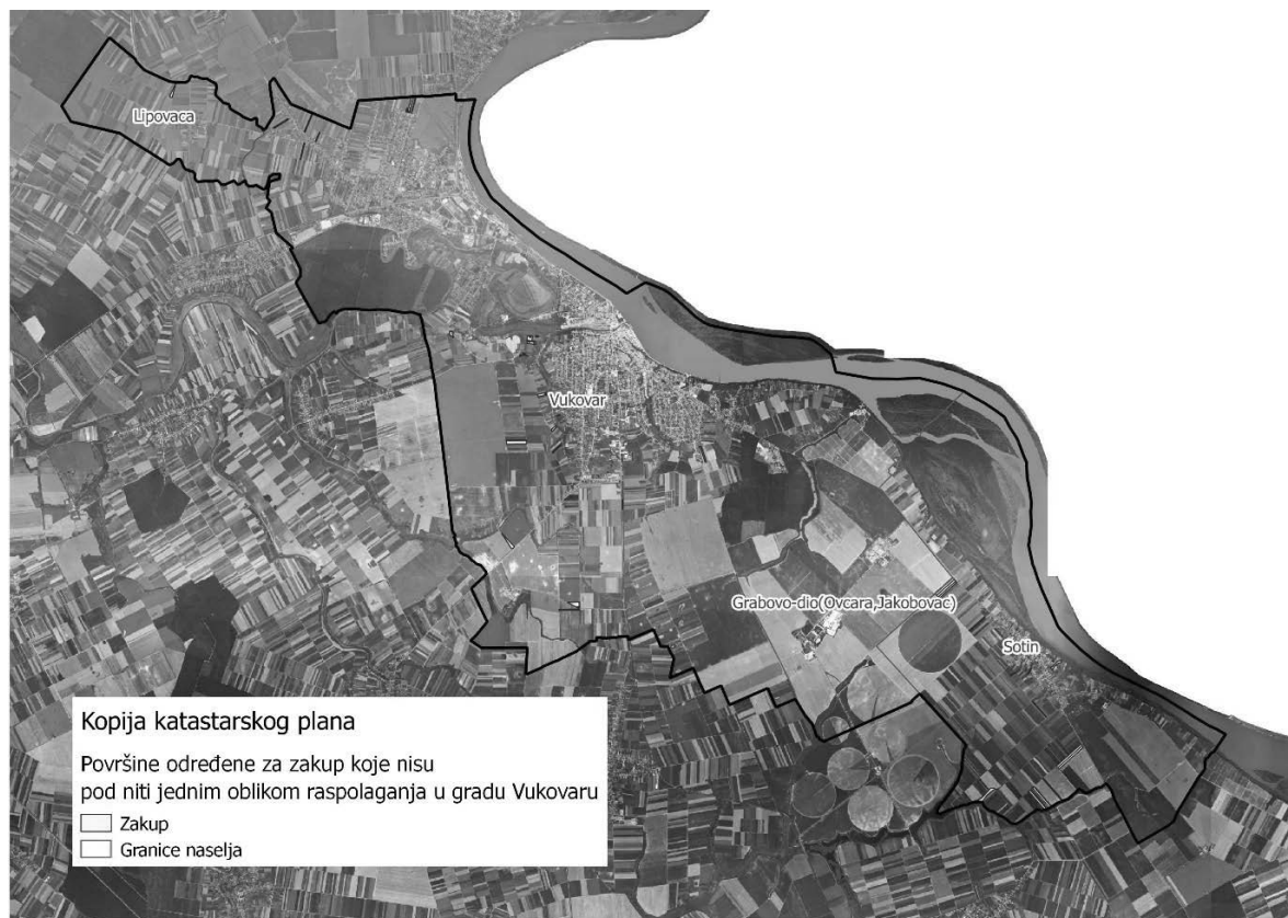
Slika 6: Površine određene za davanje u zakup koje nisu pod niti jednim oblikom raspolaganja